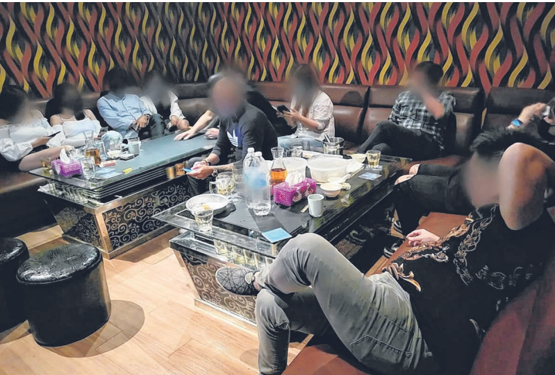
警方取缔小印度一家店屋内非法经营的KTV，97人违法聚集被调查。

他坦言，很后悔年轻时只顾打拼而不注重日常饮食，如今很多个人爱好如游泳都必须暂停。他有个心愿，就是带儿女出国旅行，可如今必须洗肾，他担心这个愿望较难实现了。