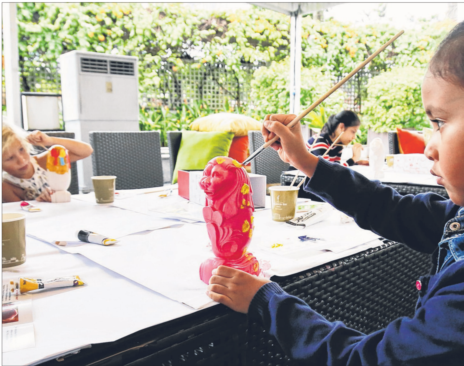
“狮城之傲，艺术从心”活动希望借助艺术的力量，让鱼尾狮化身希望的象征，同时提高公众对艺术治疗的意识。