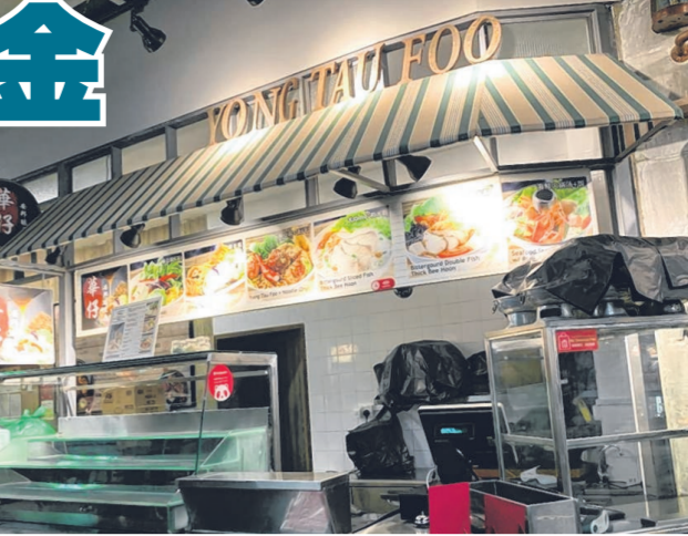
食阁一些摊位暂停营业。

“我家中有4个孩子要养，还得应付房贷、银行贷款等支出，目前只能靠丈夫在咖啡店开档的一些收入维持生活。”