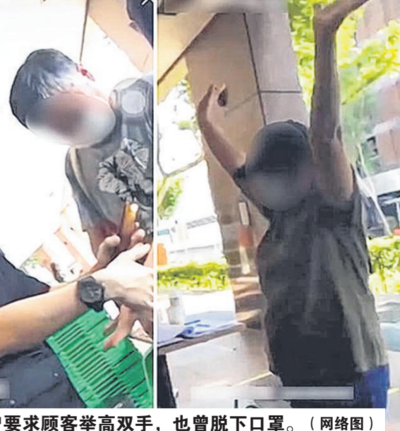
▲男职员曾要求顾客举高双手，也曾脱下口罩。

视频中显示，男职员一手拿起手机照向顾客时，另一手还握住对方的手腕。他一度与一名男顾客近距离接触时，口罩脱落，仅有一边的绳索挂在一只耳朵上。公众认为青年的做法极其不负责任，恶作剧也应分轻重，这种时候做出如此行为，可能会危害公共卫生安全。