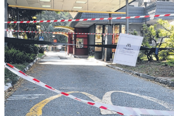
▲原本获准在5月5日重新开业的麦当劳快餐店决定继续暂停营业。（档案照）

卫生部在答复《联合早报》询问时说，当局昨天通知麦当劳，若5月3日之前没有出现新的