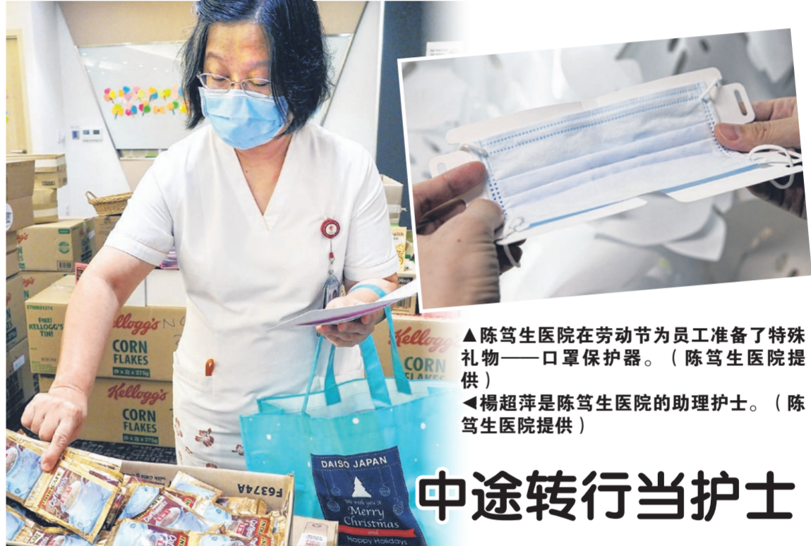
▲陈笃生医院在劳动节为员工准备了特殊礼物——口罩保护器。

不过她表示，遇到的善心人仍比较多，有时他们会给饼干、美禄或几元的小费感谢她，或仅仅是礼貌口头感谢，都让她感动不已。