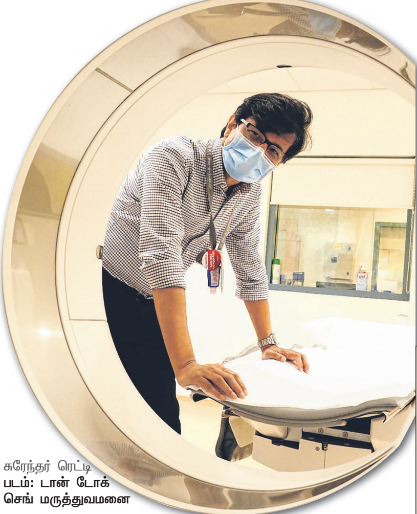
சுரேந்தர் ரெட்டி படம்: டான் டோக் செங் மருத்துவமனை

பின்பற்றப்படும் பாதுகாப்பு நடவடிக்கைகளால் தமது கதிரியக்க வியல் பிரிவில் எவருக்கும் கிருமித்தொற்று ஏற்படவில்லை என்பது இவருக்கு ஆறுதலான விஷயம்.