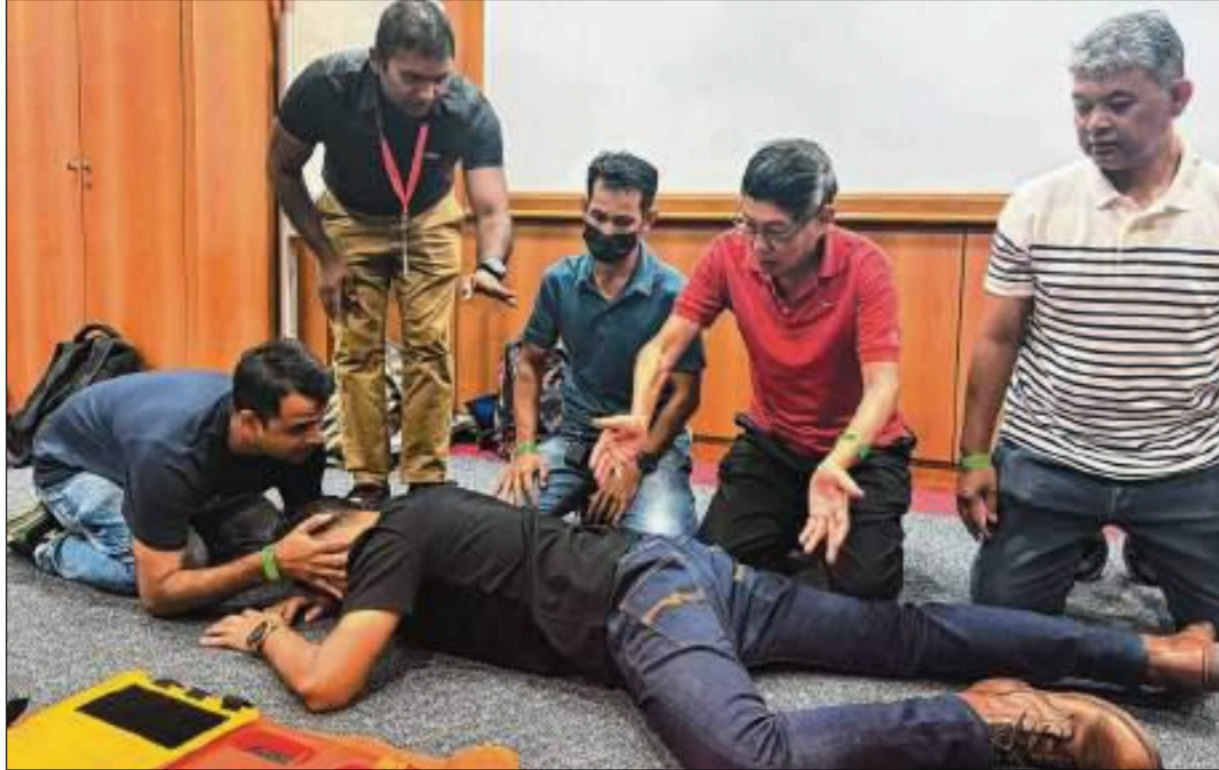
உயரத்திலிருந்து விழுவதால் ஏற்படும் ஆபத்தை எப்படிக் கையாள்வது என்பதை விளக்கும் செயல்.

டான் டோக் செங் மருத்துவமனை, பணியிடப் பாதுகாப்பு, சுகாதார மன்றத்தின் ஆதரவுடன்