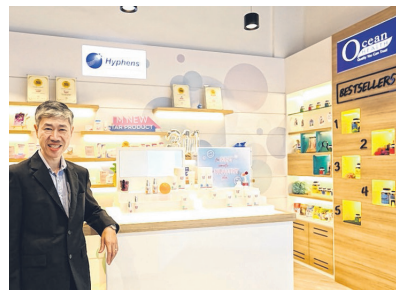
专业制药业务和专有品牌市场在短期内极具增长潜力, 有利于凯帆药剂国际。

昨天闭市报: 3329.46点 早市高点: 3357.36点 今早开市报: 3339.46点 早市低点: 3336.33点