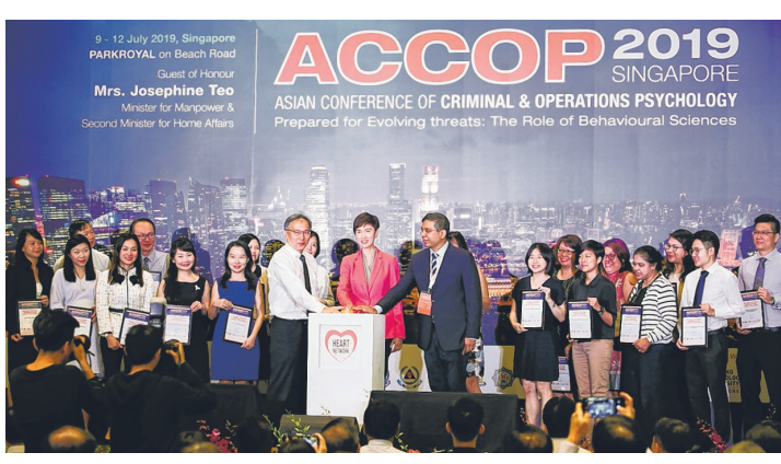
人力部长兼内政部第二部长杨莉明 (中) 今早为第四届刑事及行动心理学亚洲会议主持开幕礼, 也宣布成立心理急救小组网络。