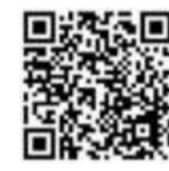
扫描二维码看母女隔空庆母亲节

陈笃生医院昨天也在面簿上张贴文和照片，透露职员过去几天充当信差，把留医病人的家属传来的照片和留言制成母亲节卡片再递给病人，也祝愿天下母亲有个快乐的母亲节。