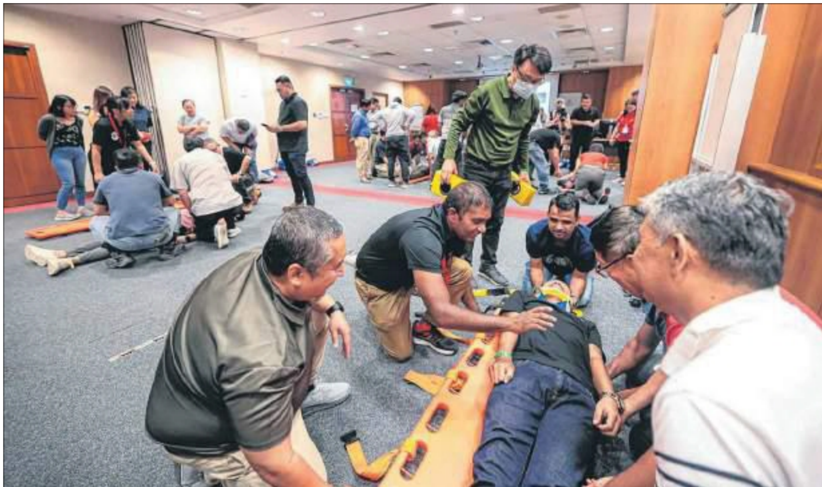
参加工伤意外防范与管理工作坊的工作场所安全卫生专员，在急救技能环节，分组学习如何将高处坠落伤者移上担架，送往就医。

配合世界创伤日，陈笃生医院与国立健保集团中部地区创伤医疗服务团队星期五（10月25日）首次举行大型工伤意外防范与管理工作坊，约200名主要来自建筑业和制造业企业的工作场所