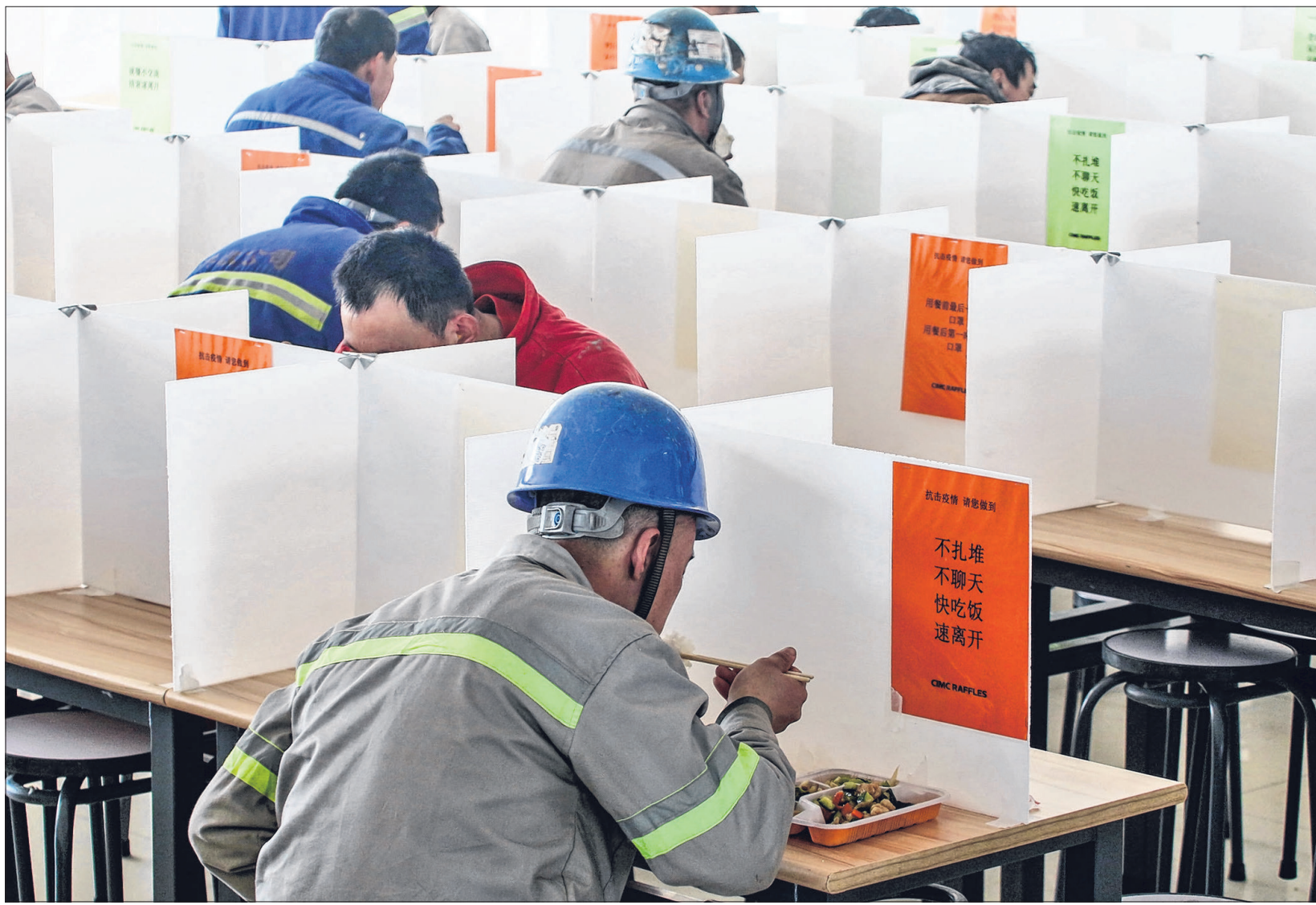
为了避免食堂用餐交叉感染，多家企业采用分散式、错时式就餐管理，位于山东烟台的这家公司就在餐桌上设隔板防止员工飞沫传播。