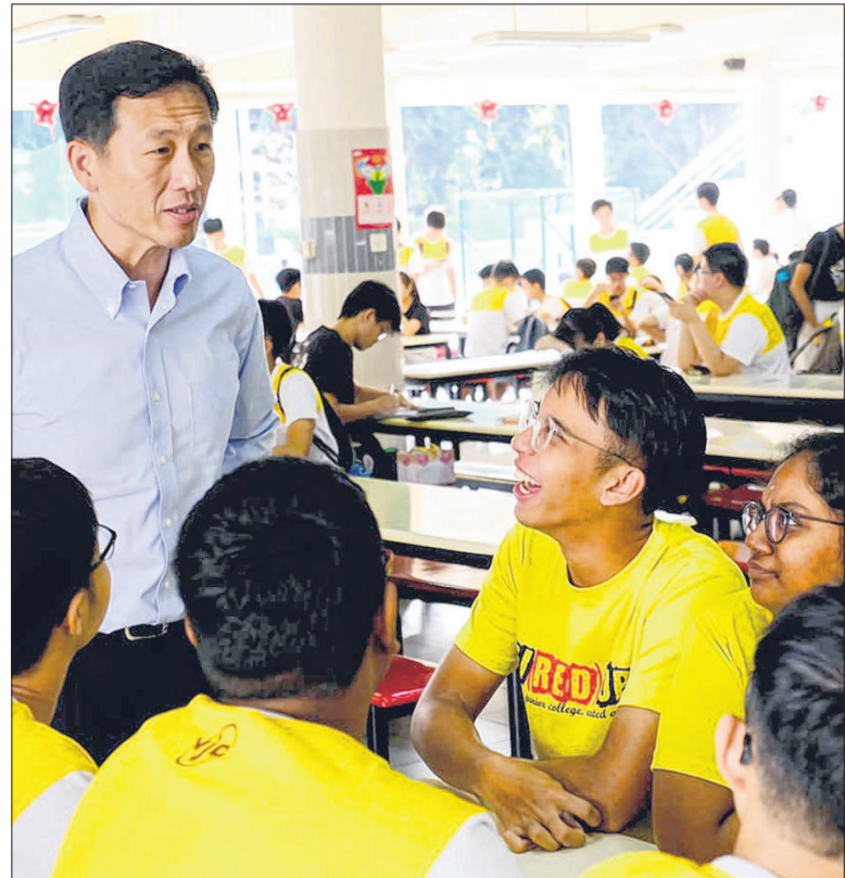
教育部长王乙康昨天走访维多利亚初级学院，了解师生自上周有一名教师确诊感染新冠病毒后，如何作出应对。

另一方面，淡滨尼美廉初级学院昨天也在Instagram发布贴文说，该校学生理事会昨天为维初教师送上两箱苹果，表达淡美初院师生在这共同抗疫期间对维初的支持。