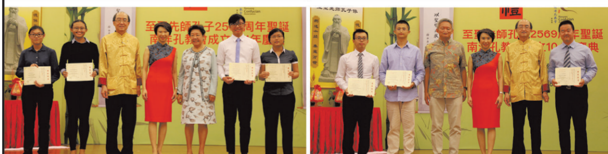
頒發“黃馬家三儒學獎”（本科生） 頒發“陳延謙中國哲學獎”（高級學位）