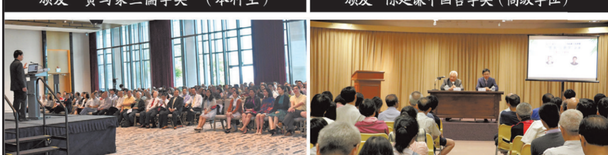
2019.5.5 百家姓先賢人物講座“顏子、曾子：復聖與宗聖” 2019.7.27 儒家與易學講座