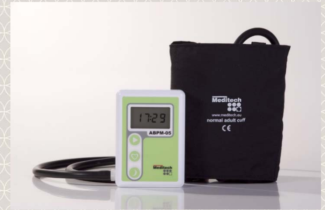
கையடக்கமான இரத்த அழுத்தப் பதிவுக்கருவியும் இரத்த அழுத்தச் சுற்றுப்பட்டையும்