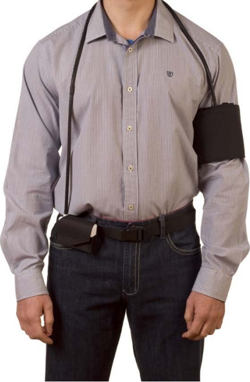
இரத்த அழுத்தக் கண்காணிப்புக் கருவி இணைக்கப்படும் முறை

அடைவியக்க இரத்த அழுத்தக் கண்காணிப்புச் சோதனையில், உங்களது இரத்த அழுத்தம் 24 மணிநேரக் காலகட்டத்தில் இடையிடையில் அளவிடப்படும். சோதனை காலகட்டம் முழுவதற்கும், நீங்கள் கையடக்கமான இரத்த அழுத்தப் பதிவுக் கருவியை உடன் வைத்திருக்கவேண்டும். மருந்தகத்தில் ஒருமுறை மட்டுமே இரத்த அழுத்தத்தை அளவிடும்போது கிடைக்கும் தகவலைவிட இந்தச் சோதனைவழி கூடுதல் தகவல் பெறமுடியும். இதன்வழி, உங்கள் இரத்த அழுத்தம் நாள் முழுவதும் எவ்வாறு மாற்றமடைகிறது என்பதை மருத்துவரால் புரிந்துகொள்ள இயலும்.