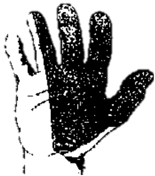
图 2 黑色部分表示手指感觉麻痹的部分