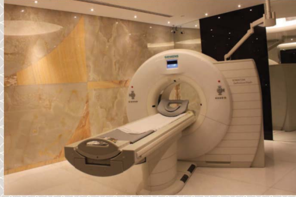
இதய CT படமெடுப்புக் கருவி

மேற்காணும் சோதனைகள் செய்து முடிக்கப்பட்ட பிறகு, ஒப்பீட்டு மையை ஏற்றுவதற்காக உங்கள் கையிலுள்ள இரத்த நாளத்தில் சிறிய பிளாஸ்டிக் குழாய் செருகப்படும். இதய CT ஆய்வுக்கூடத்தில் பரிசோதனை செய்யப்படும்.