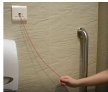
Tarik Loceng Panggilan Untuk Meminta Bantuan