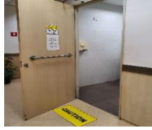
Membuka pintu yang berayun keluar