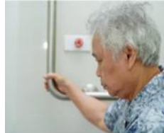
Sokong diri anda dengan memegang susur tangan di tandas