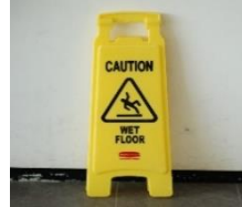
Lantai yang basah