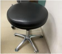
Kerusi yang beroda atau kerusi tanpa sandaran