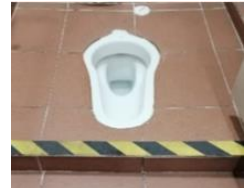
Elakkan menggunakan tandas mencangkung jika anda mempunyai kaki lemah atau berjalan yang tidak stabil