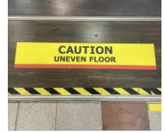
Permukaan yang tidak rata