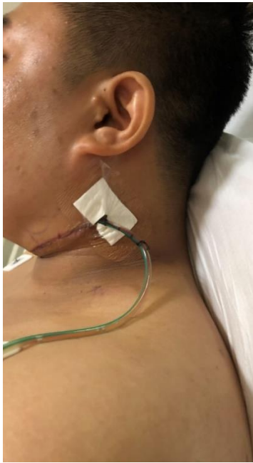
a. 将引流管贴在脖子上