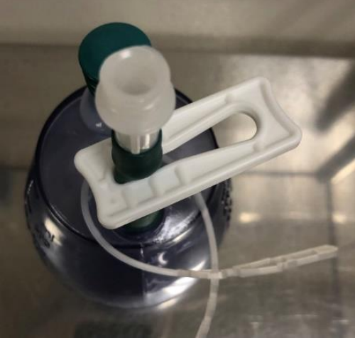
தவறு: வடிகால் அடைக்கப்பட்டுள்ளது