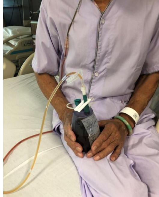
உங்களுடன் வடிகால் சுமந்து செல்லுதல்