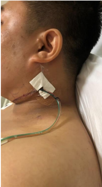
கழுத்தில் வடிகால் தட்டுதல்