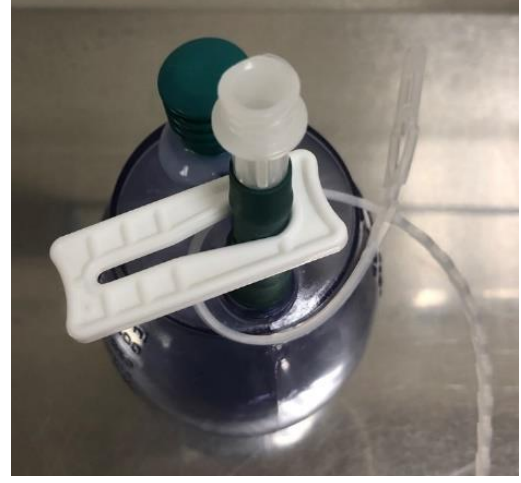
சரி: வடிகால் அடைக்கப்படவில்லை