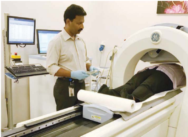
Meja pengimejan dan kamera gamma digunakan untuk memperoleh imej jantung

Ujian Pengimejan Perfusi Miokardium Tekanan Farmakologi menilai aliran darah ke otot jantung apabila jantung dipaksa bekerja lebih kuat ('tertekan'). Ujian ini menentukan kemungkinan penyumbatan dalam satu atau lebih arteri koronari. Aliran darah di dalam hati dinilai dengan menyuntik sejumlah kecil bahan kimia radioaktif, biasanya teknetium atau talium, yang diserap oleh jantung. Imej jantung kemudiannya diperolehi dengan menggunakan kamera gamma khas.