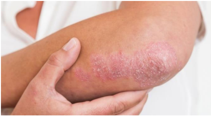
手肘上出现斑状银屑病皮疹

银屑病关节炎患者会出现关节疼痛、灼热、肿胀及在早晨时四肢和/或脊柱僵硬的体征。虽然大多数时候银屑病会在关节炎发病前出现，少部分的患者会在皮疹出现前经历关节炎的体征。