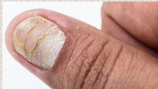
受银屑病所影响的指甲。