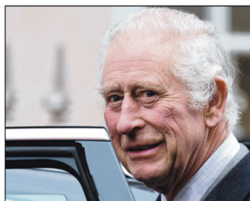
Istana Buckingham telah mengumumkan pada 5 Februari bahawa Raja Charles telah disahkan menghidap sejenis barah.

beri sebarang butiran tentang keadaannya melainkan berkata bahawa ia bukan barah prostat, namun berkata bahawa Raja Charles "kekali positif secara keseluruhannya" dan teruja kembali melakukan tugas awam seawal mungkin.