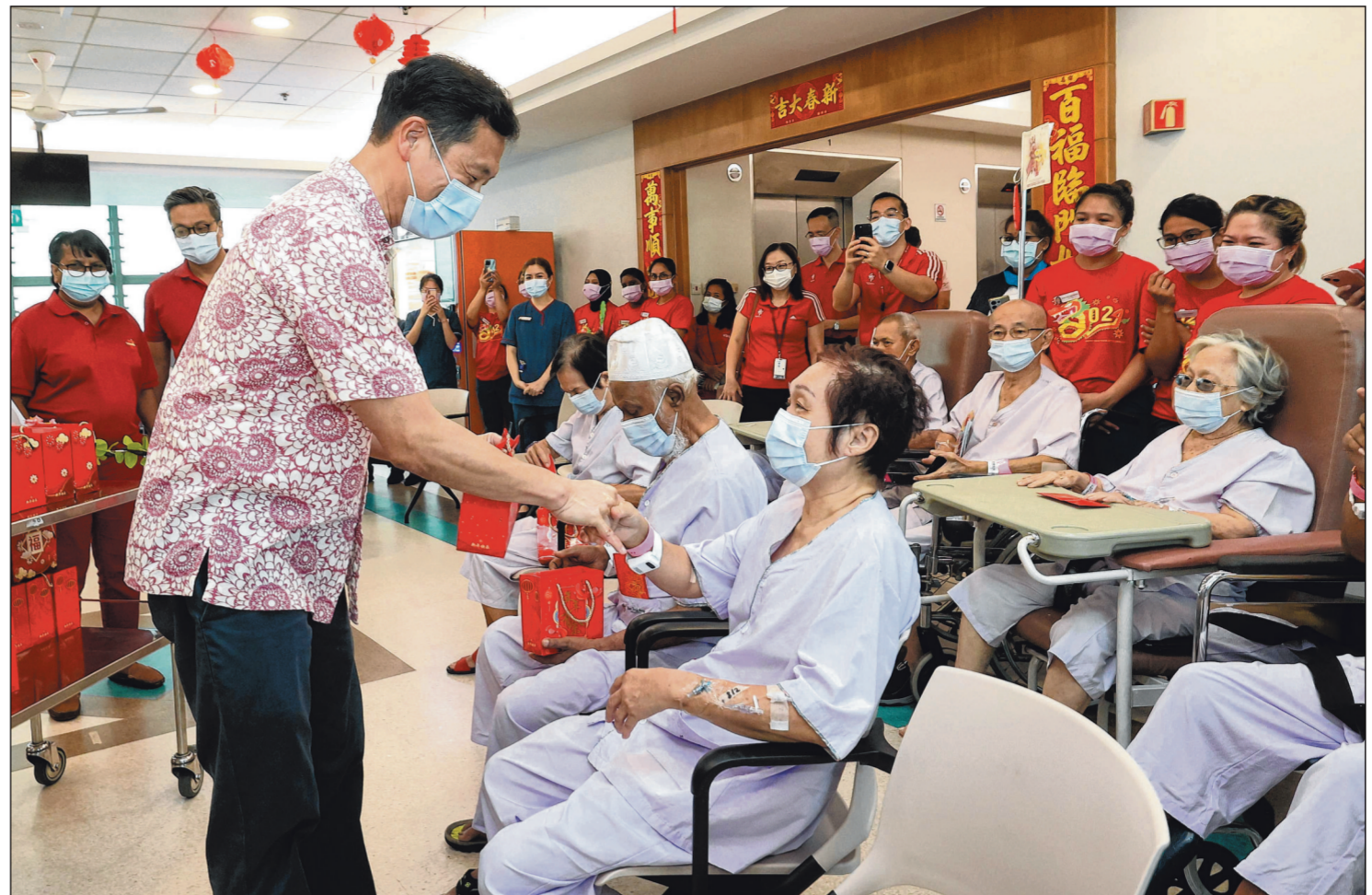
Menteri Kesihatan, Encik Ong Ye Kung, mengagihkan cenderahati kepada pesakit dan kakitangan ketika mengunjungi Hospital Tan Tock Seng sempena Tahun Baru Cina pada 10 Februari.

Singapura mengalami kadar pengurangan jururawat asing yang lebih tinggi pada 2021