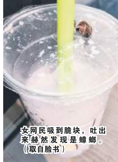
▲网民吸到脆块，吐出来赫然发现是蟑螂。

女子称喝豆浆时咬到脆块，吐出来时赫然发现是蟑螂。Mr Bean致歉，并表示正进行内部调查。