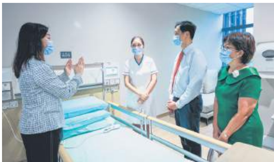
▲中区市市长潘丽萍（右一）和卫生部长王乙康（右二）参观托福园的病房。