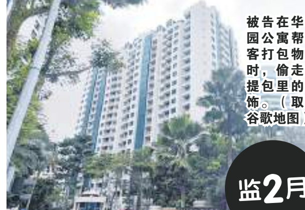
被告在华丽园公寓帮顾客打包物品时，偷走手提包里的首饰。