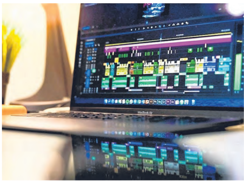
在网络世界里,适当剪辑过的影片更能增强代入感,把你的想法更好的表达。

Photoshop相同的功能,但如果想为影片简单调色,也可在荧幕上方的视窗(Windows)选单利用“Lumetri Colour”功能——除了有调整色温、曝光度等,也能使用内置已调好的滤镜组合,操作轻松,便可让影片拥有电影画质般的色调。