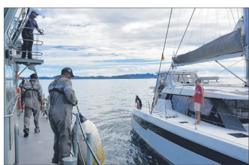
59岁本地商人（右）在我国外交部和斐济当局协助下，终于安全靠岸。

“今早（4月30日），他（黄姓商人）已安全抵达距离我国超过8000公里外的岛国——斐济。非常感谢斐济政府听到情况后尽力援助，尤其是获悉因人因大风大浪，无法自行将游艇驶进海港