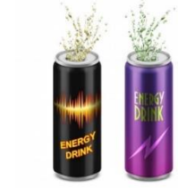
ஆற்றலை அதிகரிப்பதற்கான பானங்கள்