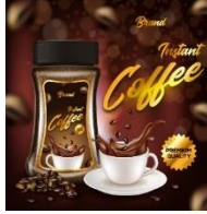
உடனடியாக தயார் செய்யக்கூடிய பானங்கள்