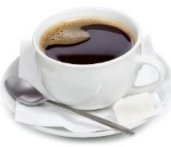
சர்க்கரை இல்லாமல் தேநீர் / காப்பி