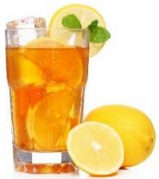
இனிப்பு சேர்க்கப்படாத தேநீர்