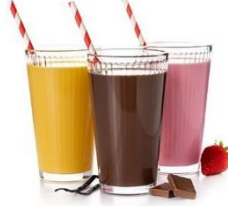
முழு கிரீம் அல்லது செயற்கை சுவை பால்