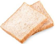
হোলমিল রুটি (2 টি) = $0.20

বাজারের সম্পূর্ণ অংশ ব্যবহার করুন, উদাঃ তরকারী রান্না করতে বেচে যাওয়া শাকসবজি ব্যবহার করা যেতে পারে