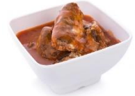
টমেটো সসে সারডাইন (1 ক্যান 155 গ্রাম) = $1.10