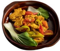
বারতি শাকসবজি দিয়ে তরকারী