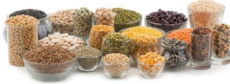
শিম বা ডাল জাতীয়