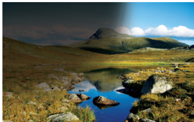
视网膜脱落时，部分视力就像被“布帘”遮住一样。

眼睛切面图显示眼角膜、晶体、玻璃体和视网膜的位置与关系，以及眼睛如何将光线投影在视网膜上。