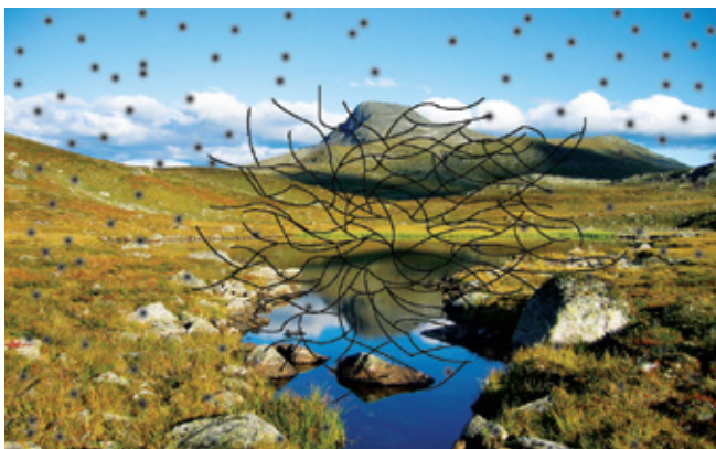
图1：玻璃体退化患者看到的浮游物——飞蚊症的现象。