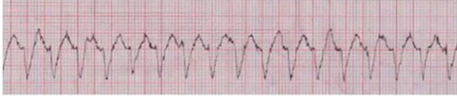
மரணம் விளைவிக்கும் இதயத்துடிப்பு