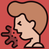
Kahak yang pekat atau berdarah