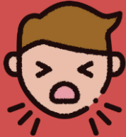
Batuk yang semakin teruk