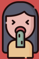
Muntah atau sakit perut