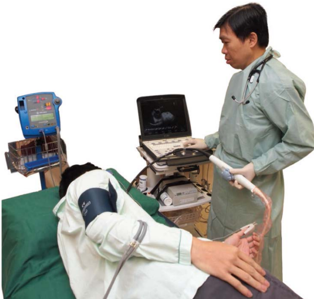
Tee sedang dijalankan

TEE membolehkan pemeriksaan terperinci jantung dan saluran darah besar di dada. Ia sangat berguna untuk pesakit yang imejnya tidak diperolehi dengan baik melalui Ekokardiografi Transtoraks (TTE). Ia juga berguna untuk memeriksa bahagian jantung dan saluran darah utama yang tidak dapat dilihat dengan baik melalui TTE.