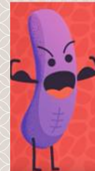
MDR-TB ubat pengambilan selama 20 hingga 24 bulan